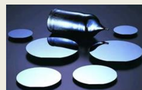
ガリウム砒素基板